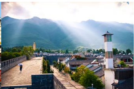
หมู่บ้านฮี้โจว(หมู่บ้านชาป๋อ)