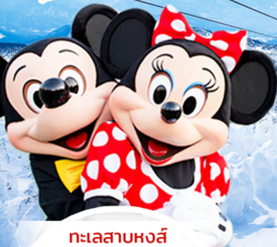
ทะเลสาบหงส์