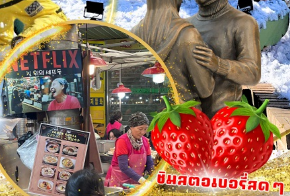
ตลาดกวางจง