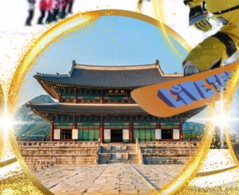
พระราชวังเคียงบกกรุง