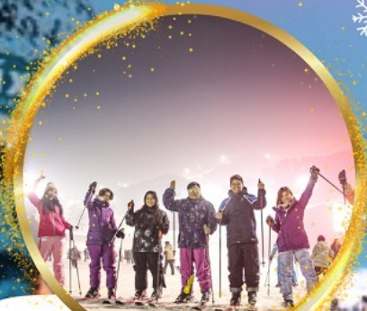
เล่นสกีสุดมันส์