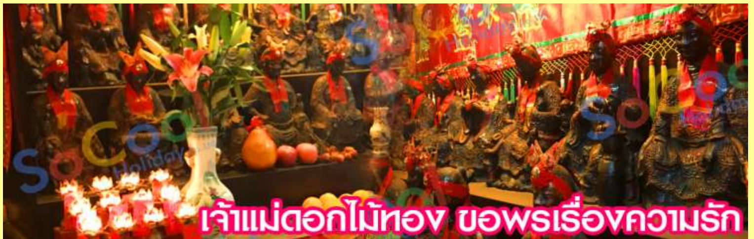
เจ้าแม่ดอกไม้ทอง ขอพรเรื่องความรัก