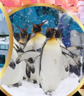
สวนสัตว์ อาซาฮิยาม่า