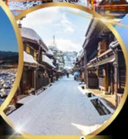
ทาคายาม่า