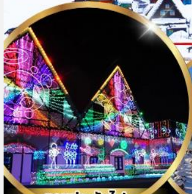
งานประดับไฟ Tokyo german village