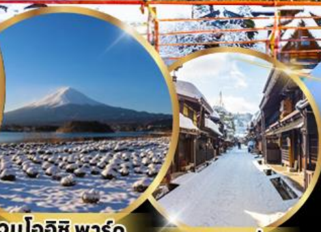
สวนโออิชิ พาร์ค