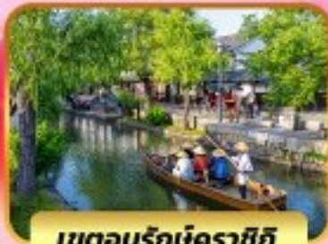
เขตอูร์กบ์คุราชิกิ