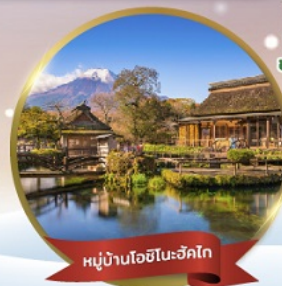
หมู่บ้านโอชิโนะฮักโก