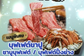
เมนูพิเศษ บุฟเฟ่ต์ชาบู ชาบูบุฟเฟ่ต์ / บุฟเฟ่ต์บิงย่าง