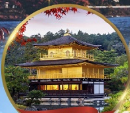
วัดทองคินคะคุจิ

ชมใบไม้เปลี่ยนสีที่ฟุจิ • หมู่บ้านชิราคาวาโกะ • เมืองเก่าทาคายาม่า สวนสนุกยูนิเวอร์แซลสตูดิโอ (รวมค้ำบัตรเข้า) • หมู่บ้านโอชิโนะอักษิโก ศาลเจ้าฟูชิมิอินาริ • วัดทองคินคะคุจิ • วัดอาซากุสะ • ตลาดปลาซีทิจิ