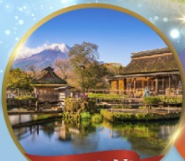
หมู่บ้านโอชิโนะอักษิโก