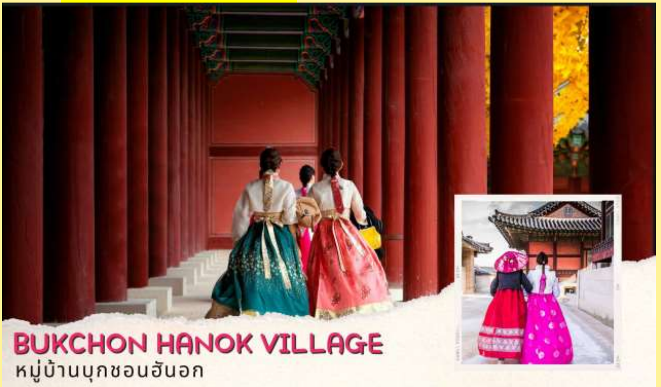
BUKCHON HANOK VILLAGE หมู่บ้านบุกซอนฮันอก

นำท่านชม ศูนย์โสมรัฐบาล (Ginseng) ซึ่งรัฐบาลรับรองคุณภาพว่าผลิตจากโสมที่มีอายุ 6 ปีซึ่งถือว่าเป็นโสม ที่มีคุณภาพดีที่สุดชมวงจรชีวิตของโสมพร้อมให้ท่านได้เลือกซื้อโสมที่มีคุณภาพดีที่ที่สุดและราคาถูกกว่าไทย ถึง 2 เท่าเพื่อนำไปบำรุงร่างกายหรือฝากญาติผู้ใหญ่ที่ นำท่านชม ศูนย์น้ำมันสนเข็มแดง (Red Pine) เป็น ผลิตภัณฑ์ที่สกัดจากน้ำมันสนมีสรรพคุณช่วยบำรุงร่างกายลดไขมันช่วยควบคุมอาหารและรักษาสมดุลใน ร่างกายได้เป็นอย่างดี จากนั้นชม พระราชวังเคียงบก ซึ่งเป็นพระราชวังไม้โบราณที่เก่าแก่ที่สุด กว่า 600 ปี ภายในพระราชวังแห่งนี้มีหมู่พระที่นั่งมากกว่า 200 หลัง แต่ได้ถูกทำลายไปมากในสมัยที่ญี่ปุ่นเข้ามาบุกยึด ทั้งยังเคยเป็นศูนย์บัญชาการทางการทหารและเป็นที่พักของกษัตริย์ ปัจจุบันได้มีการก่อสร้างหมู่พระที่ นั่งที่เคยถูกทำลายขึ้นมาใหม่ในตำแหน่งเดิม ถ่ายภาพคู่กับพลับพลากลางน้ำเคียงเฮวรู ที่ซึ่งเคยเป็นท้องพระ โรงออกงานโสมสรส้นนิบาตต่าง ๆ (ให้เวลาท่านเข้าสู่ชุดฮันบกสวย ๆ หน้าพระราชวังและถ่ายรูปตาม อัยยาศัย **ค่าเช่าชุดรวมไม่รวมในค่าทัวร์** )