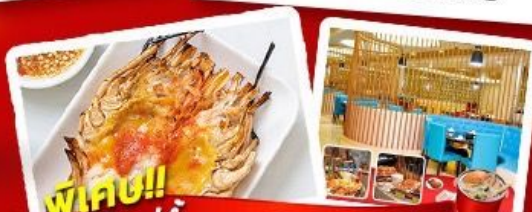
พิเศษ!! ก๊วยแม่ น้ำ + HOTPOT SEAFOOD