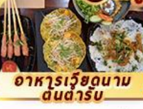
อาหารเวียดนาม ดินดำรับ