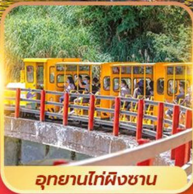
อุทยานไท่ผิงซาน