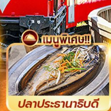
เมนูพิเศษ!!