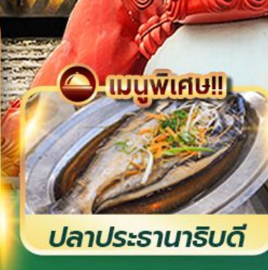
เมนูพิเศษ!! ปลาประรานาธิบดี