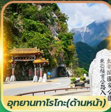
อุทยานทาโรโกะ(ด้านหน้า)