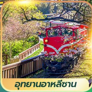
อุทยานอาหลีซาน

เที่ยวครบ 4 อุทยาน !! อาหลีซาน - ไถ่ฝิงซาน - เหยหลิว - ทาโรโกะ