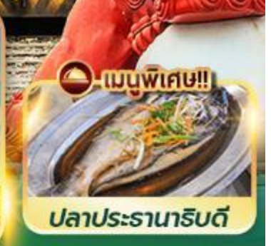
เมนูพิเศษ!! ปลาประรานาธิบดี