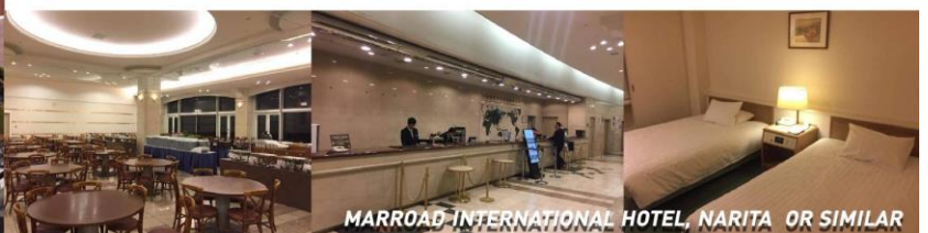
MARROAD INTERNATIONAL HOTEL, NARITA OR SIMILAR