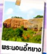
พระนอนอึ้งหยาง