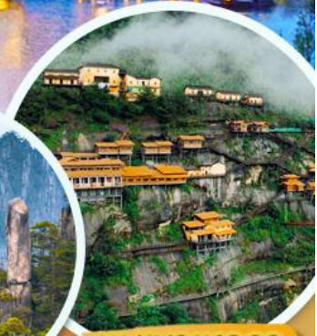
หุบเขาเทวดา

เมนูพิเศษ!! เปิดปักกิ่ง หมูแดง ปลาหมักเป็ยร้อฮยาง