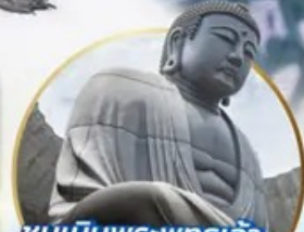
ชมเนินพระพุทธรเจ้า.. Hill of the Buddha

ไฮไลท์!! สนุกสนานกับกิจกรรมทะเลหิมะ ณ ลานสโนว์ เวิลด์ ฮักไซฟาโนรามา เยี่ยมชมเนินพระพุทธรเจ้า ชมความน่ารักเหล่าสัตว์ ณ สวนสัตว์อาซาฮิยาม่า ชมคลองโอดาธา เข้าชมพิพิธภัณฑ์ถ้ำถ้ำสองดนตรี สัมรสราเมง ณ หมู่บ้านราเมนอาซาฮิคาว่า ช้อปบิงจูกิจิ กาบุคิโคจิ อีเมอร์ออย!! บุปเฟ่ต์ซาบู และซาบูยักนิ