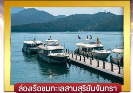
ส่องเรือชมทะเลสาบสุริยันจันทรา