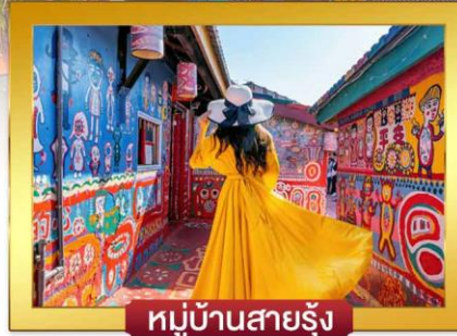
หมู่บ้านสายรุ้ง