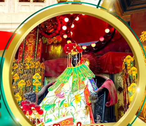
เจ้าแม่กวนอิม อิมฮ่องฮ่า