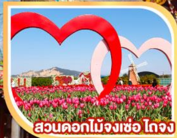
สวนดอกไม้จงฮ่อ ไถจง