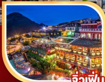
จีวเฟิ่น