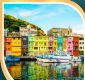
ท่าเรือเจิ้งปิน