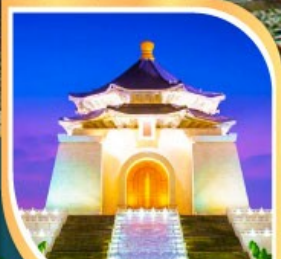
เจียงไคเช็ค