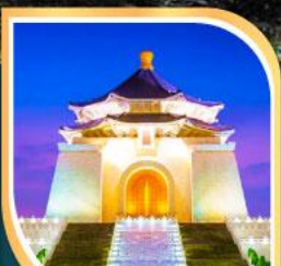
เจียงโกเชิก