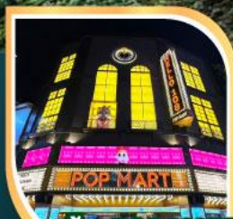
ร้าน POP MART ที่ใหญ่ที่สุดในไต้หวัน