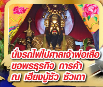
นั่งรถไฟไปศาลเจ้าพ่อเสือ ขอพรธุรกิจ การค้า ณ เชียงมู้อู๋ ชิวเกา