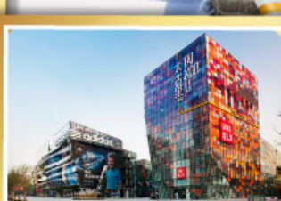
ช้อปปิ้ง SANLITUN