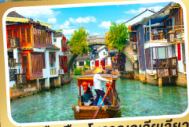
ล่องเรือเมืองโบราณซูเจียเจียว