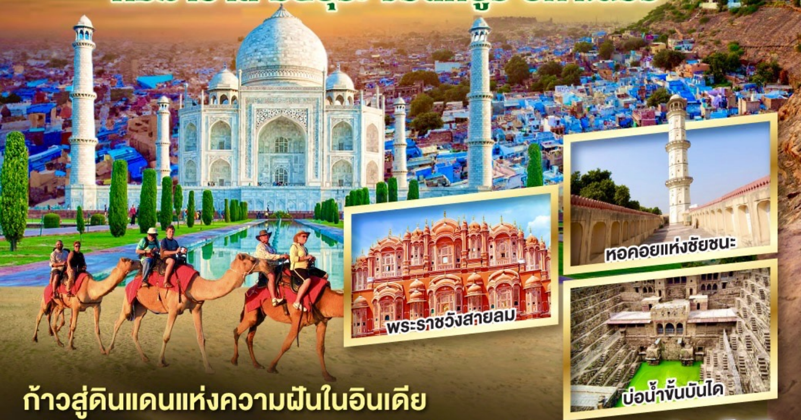
หอคอยแห่งชัยชนะ