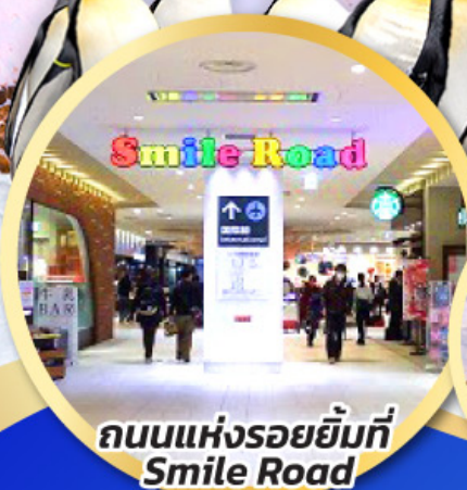
ถนนแห่งรอยยิ้มที่ Smile Road