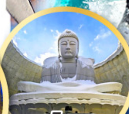
เป็นเขา แห่งพระพุทธรเจ้า

ชมความน่ารักของสัตว์ต่างๆ ที่พิพิธภัณฑ์สัตว์น้ำโอตารุ