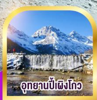
อุทยานปี่เผิงโก