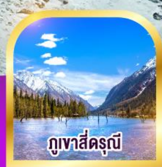
ภูเขาสี่ตรุนี