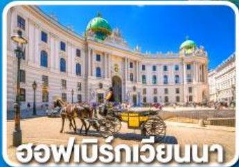
ฮอฟบวร์กเวียนนา