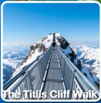
The Titlis Cliff Walk