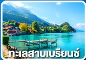
ทะเลสาบเบรียนซ์