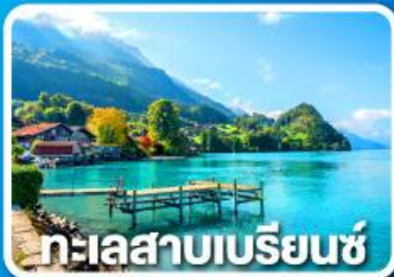
ทะเลสาบเบรียนซ์