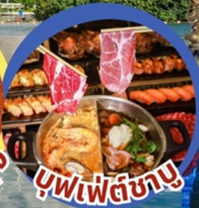
บุฟเฟต์ชาบู