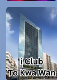
i Club To Kwa Wan

คอนเฟิร์มเดินทาง พฤศจิกายน 2567 2-4 / 9-11 / 16-18 23-25 / 30 พ.ย. - 2 ธ.ค.