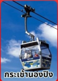
กระเช้านอ้งปีง