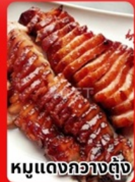
หมูแดงกวางตุ้ง