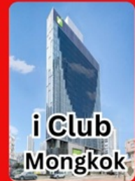
i Club Mongkok

คอนเฟ้รมเดิ่นทาง พ.ย.67 1-3 / 8-10 / 15-17 / 22-24 พัก 4 ดาวย่านช้อปปีง i CLUB MONGKOK