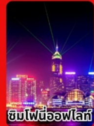
ชิมไฟ้ท้อฟโล่กั้

ราคาเดี๋ยวเท่ียวเกิ่นคุดั่ม 15,999 บาท/ท่า่น