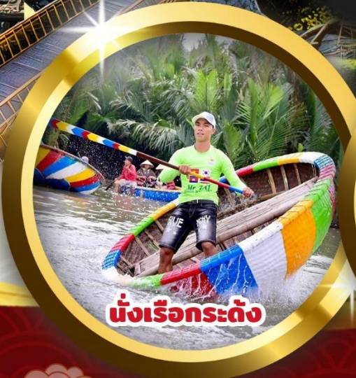
นั่งเรือกระดิง