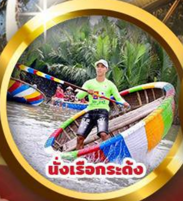
นั่งเรือกระดิ่ง