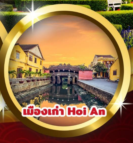
เมืองเก่า Hoi An