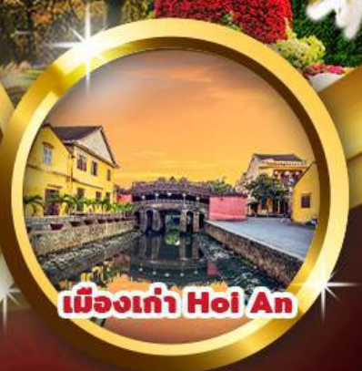
เมืองเก่า Hoi An