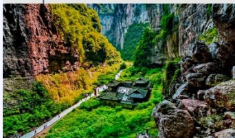
อุทยานแห่งชาติหลุมฟ้า 3 สะพานสวรรค์