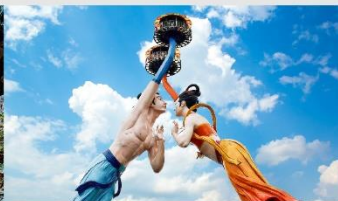
Wulong Flying Kiss