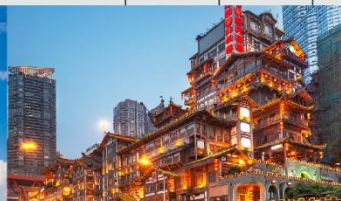
หงหยาดัง