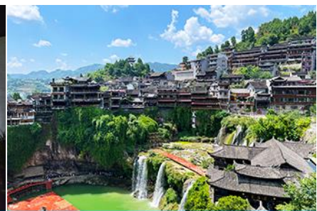
เมืองโบราณฝูหรงเจิน

วันที่สาม เมืองฉางเจียเจีย-ตึกมหิศวรรษย์ 72 ชั้น-พิพิธภัณฑ์ภาพหินทราย –ศูนย์แพทย์แผนจีน-เมืองโบราณฝูหรงเจินยามค่ำคืน