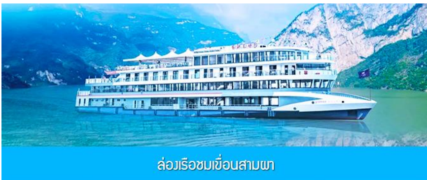
ล่องเรือชมเขื่อนสามผา