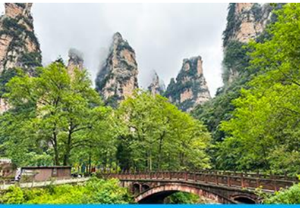
จุดชมวิวจินเปียนซี