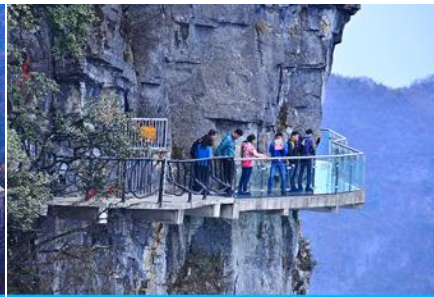
หน้าพลาวยฟ้าทางเดินกระจก