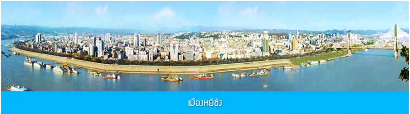
เมืองหยีซัง