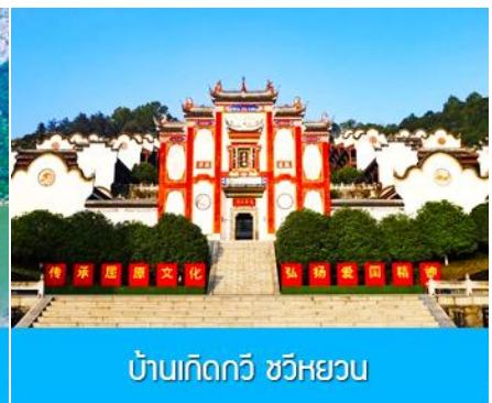
บ้านเกิดกวี ชวีหยวน