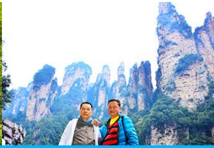
ชมจุดชมวิวลีฟท์แก้ว