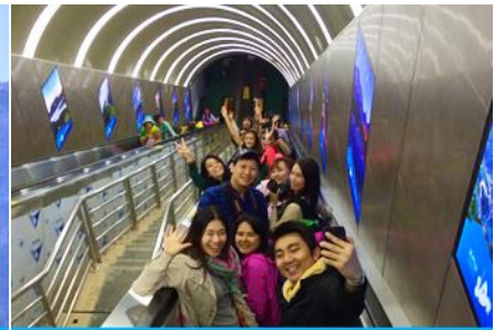
บันไดเลื่อนทะเลภูเขา