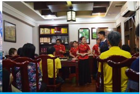
ร้านใบชา