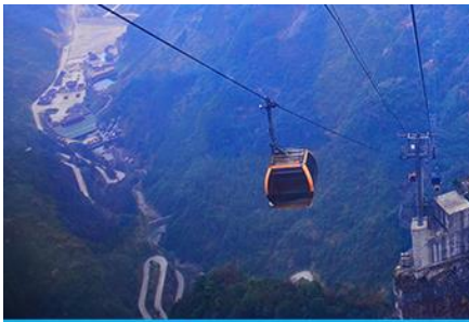
กระเช้าขึ้นเขาเทียนเหมินซาน