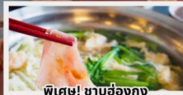
พิเศษ! ซาบูฮ่องกง

พักรูในดิสนีย์แลนด์ 1 คืน พร้อมบัตรเครื่องเล่นแบบจุใจ