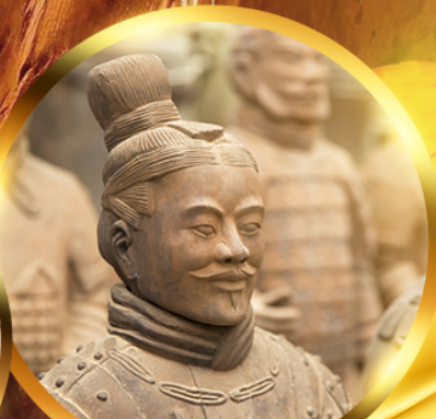
สุสานทหารจีนซี