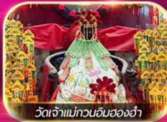
วัดเจ้าแม่กวนอิมสองอ่า