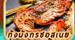
กุ้งมังกรชอสนาย