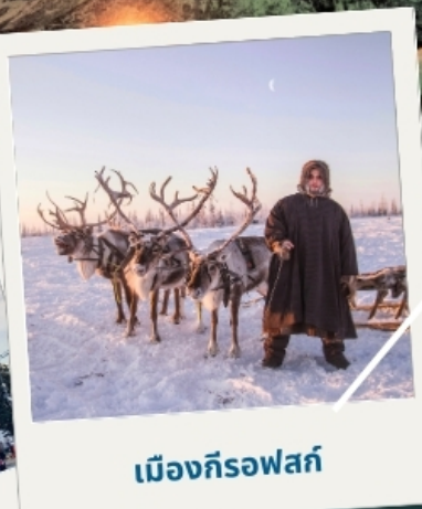
เมืองก็รอฟสค์