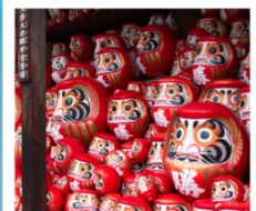
วัดคิตสึโอจิ