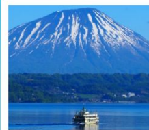
ค่องเรือทะเลสาบโทเยะ