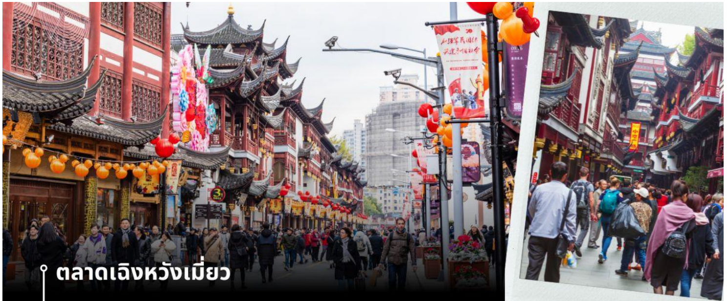
📍 ตลาดเจิงหวังเมี่ยว

จากนั้นนำท่านสู่ ตลาดเจิงหวังเมี่ยว เป็นศูนย์รวมสินค้า และอาหารพื้นเมืองที่แสดงถึงเอกลักษณ์ของชาวเซี่ยงไฮ้ซึ่งมีการผสมผสานระหว่างอดีตและปัจจุบันได้อย่างลงตัว ซึ่งเป็นย่านสินค้าราคาถูกที่มีชื่อเสียงย่านหนึ่งของนครเซี่ยงไฮ้ให้ท่านอิสระช้อปปิ้งตามอัธยาศัย