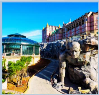
โซอู Eclipse Square