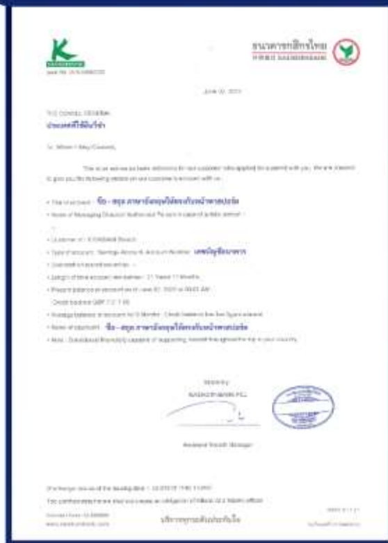
ตัวอย่าง Bank Statement ที่ผู้สมัครต้องขอจากธนาคาร