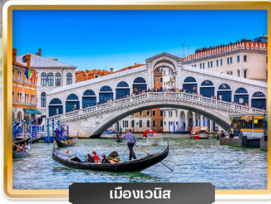
เมืองเวนิส