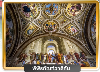
พิพิธภัณฑท์วาติกัน