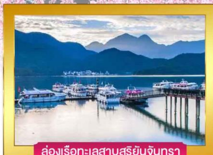
ล่องเรือทะเลสาบสุริยันจันทรา