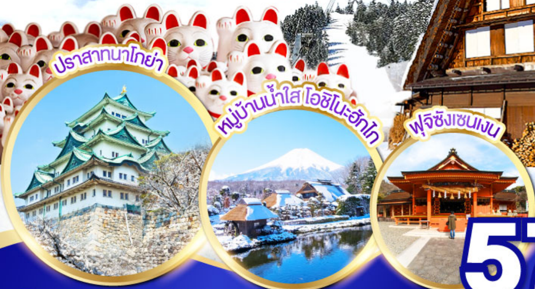
ปราสาทนาโกย่า