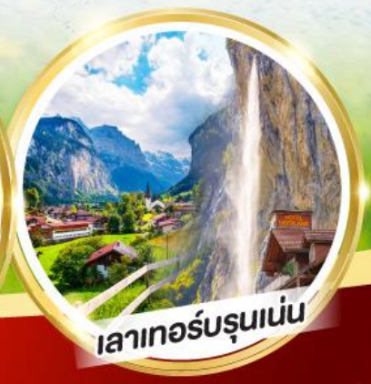
เลาเทอร์บรุนเนน