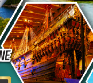
น้ำพุแห่ง ราชินีเดฟวอน