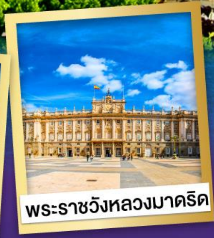
พระราชวังหลวงมาดริด