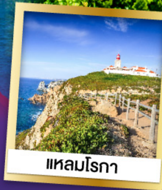
แหลมโรกา