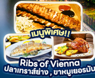
เมนูพิเศษ! Rib's of Vienna ปลาเทราสย่าง, บาหมูเยอรมัน