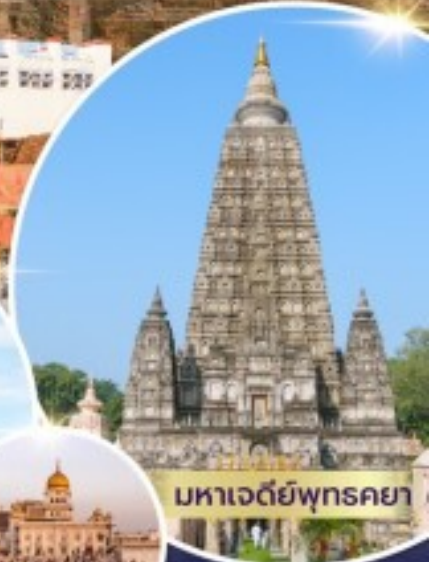
มหาเจดีย์พุทธคยา